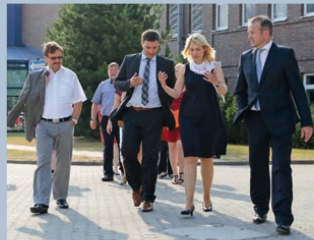
Mecklenburg-Vorpommerns Arbeitsministerin Manuela Schwesig beim Vor-Ort-Besuch bei REMONDIS EURAWASSER

Die Vereinbarkeit von Erwerbs- und Privatleben ist bei EURAWASSER Rostock ein fester Bestandteil in der Unternehmenskultur und im Demografiekonzept der Firma. Das Zertifikat wurde erstmals an eine Firma der Wasserwirtschaft vergeben.