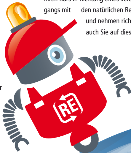
Robin der Rohstoffretter ist das Maskottchen der Wertstoffprofis

haltigkeit“ und „Ressourcenknappheit“ in methodisch vielfältiger Form an Kinder und Jugendliche herangetragen werden sollen. DIE WERTSTOFFPROFIS halten demnach ihren Kurs in Richtung eines verantwortungsvollen Umgangs mit den natürlichen Ressourcen unseres Planeten und nehmen richtig Fahrt auf. Springen auch Sie auf diesen Zug auf?